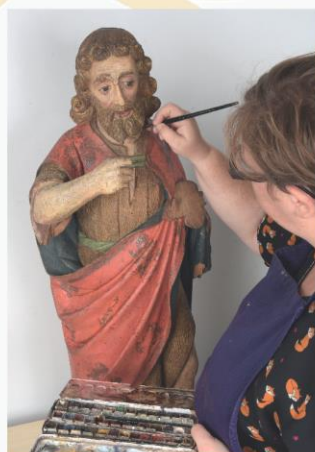
Restauration d'une oeuvre du Musée Savoisien, Chambéry

ARC-Nucléart est un atelier et un laboratoire de recherche dont les missions sont dédiées à la conservation et à la restauration des objets du patrimoine culturel en matériaux organiques. En tant que membre du Conseil d'Administration du Groupement d'Intérêt Public ARC-Nucléart, les objectifs de ProNucléart sont :