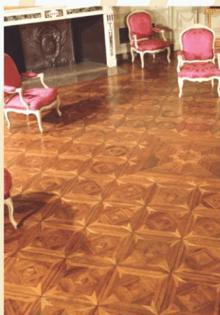
Parquet de l'Hôtel de Lesdiguières, Grenoble