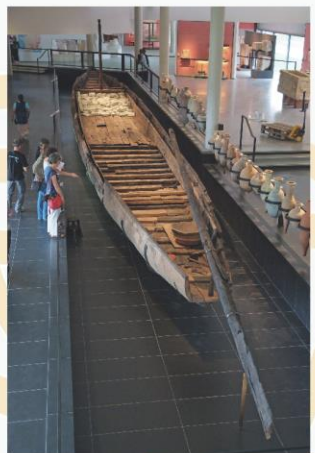
Chaland Romain Arles Rhône 3 au Musée Départemental d'Arles Antique