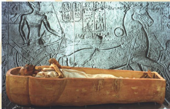
Momie du pharaon Ramsès II désinfectée par exposition au rayonnement gamma par l'équipe d'ARC-Nucléart en 1977

En 1974, pour promouvoir l'action entreprise au Commissariat à l'Energie Atomique & aux Energies alternatives (CEA) par son fils Louis, Ingénieur de la Section d'application des radioéléments et des rayonnements, décédé l'année précédente, le Général Raoul de Nadaillac fonde l'association « ProNucléart ». L'objectif de ProNucléart est de soutenir l'activité d'ARC-Nucléart, initiée en 1970 par Louis de Nadaillac, et de participer à la diffusion des connaissances relatives aux traitements fondés sur les propriétés du rayonnement d'origine nucléaire.