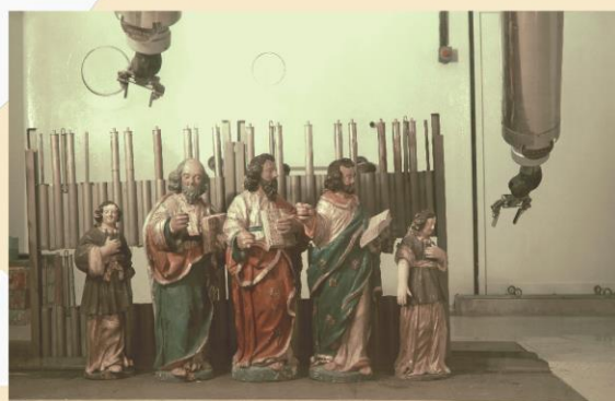
Désinsectisation de sculptures par exposition au rayonnement gamma