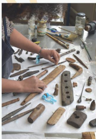
Objets provenant de Charavines, Site médiéval de Colletière